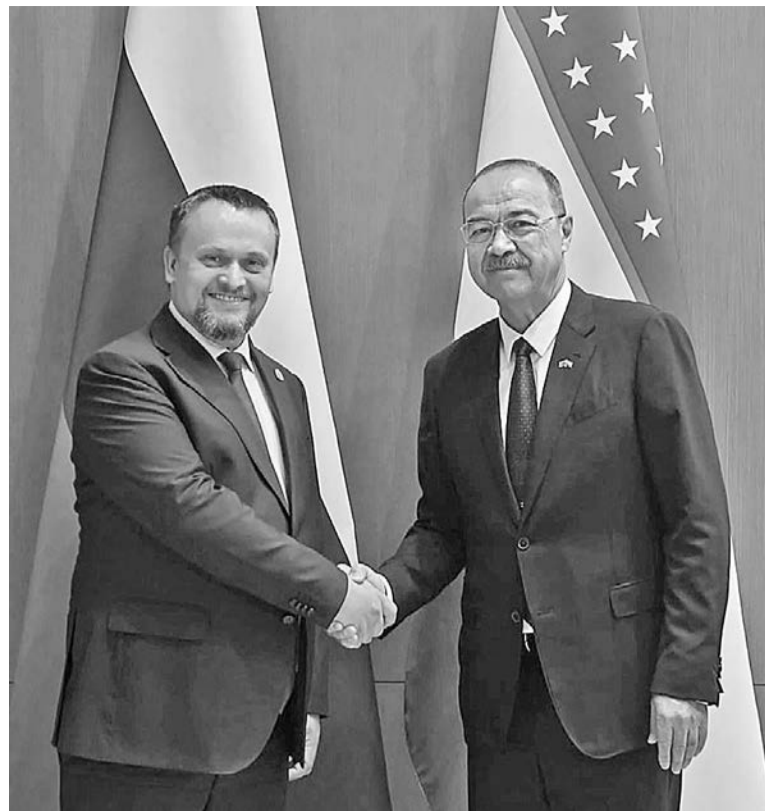
В рамках визита Андрей Никитин встретился с премьер-министром Узбекистана Абдуллою Ариповым.

Среди других направлений для развития партнёрских отношений между Узбекистаном и Новгородской областью – станко- и двигателестроение. Новгородцы будут рады видеть узбекские предприятия в составе