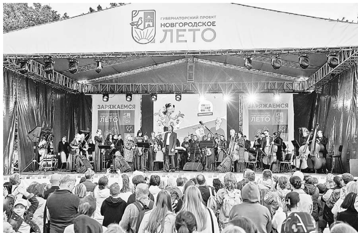
Официальный старт «Новгородскому лету» будет дан 1 июня.

А вот участок набережной, к которому прилегают жилые многоквартирные дома, использовать для проведения массовых мероприятий не собираются. Как