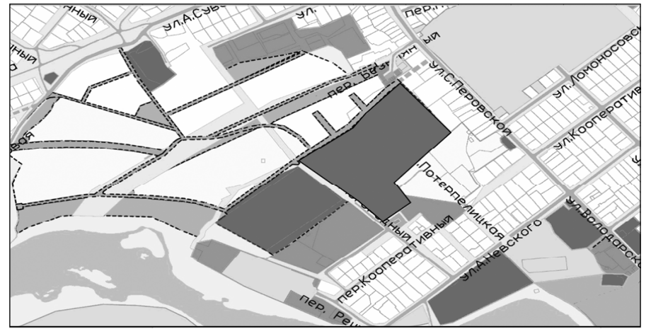
СХЕМА ВНЕСЕНИЯ ИЗМЕНЕНИЙ В ПРАВИЛА ЗЕМЛЕПОЛЬЗОВАНИЯ И ЗАСТРОЙКИ БОРОВИЧСКОГО ГОРОДСКОГО ПОСЕЛЕНИЯ