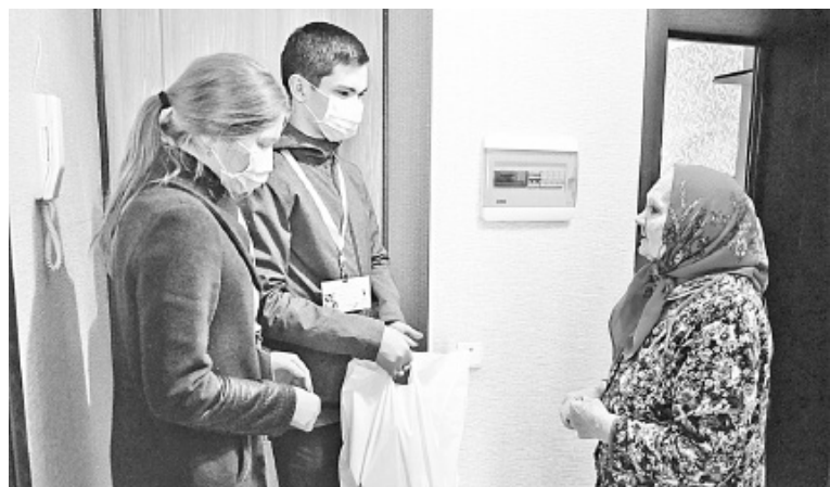
Волонтеры доставляют пенсионерам домой продукты, лекарства, корма для животных, оплачивают квитанции ЖКХ, помогают по хозяйству

Около 500 компаний из разных регионов России уже присоединились к акции #МыВместе. На сайте мывместе2020.рф они указали, какую конкретную поддержку готовы оказать. В частности, деньгами и медоборудованием выразили желание помочь порядка 300 организаций.