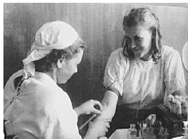
В экспозиции представлено множество уникальных фотографий

В музее истории г. Боровичи открылась масштабная выставка, посвящённая нашему городу в годы Великой Отечественной войны.