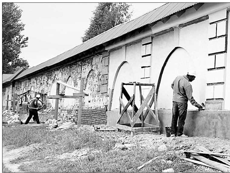
Реставрация старинной ограды монастыря.