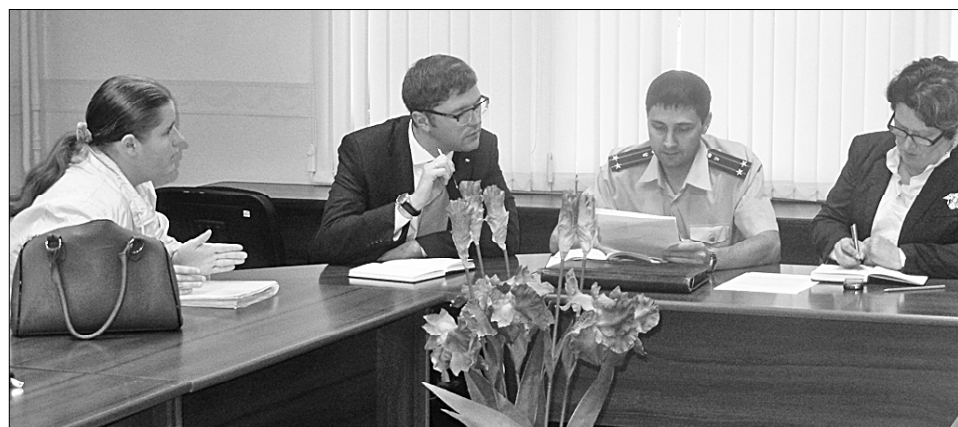
Предварительное изучение документов — первый шаг на пути к решению проблемы.