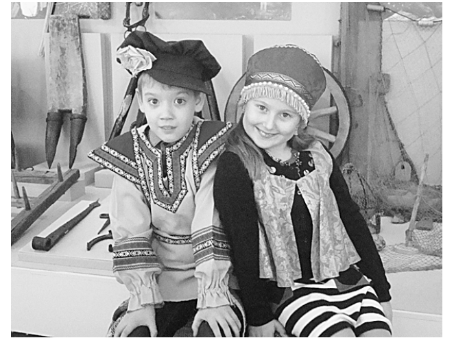
Цвет черёмух очень белый, А цвет неба — голубой. Я тебя расцеловала, Теперь дело за тобой.

Итоги конкурса мы подведем к 1 октября. Победителей ждут призы от «Фотоцентра ТК «Европа»: цифровой фотоаппарат, сертификат на печать снимков в фотоцентре на сумму 1500 рублей, поощрительные призы.