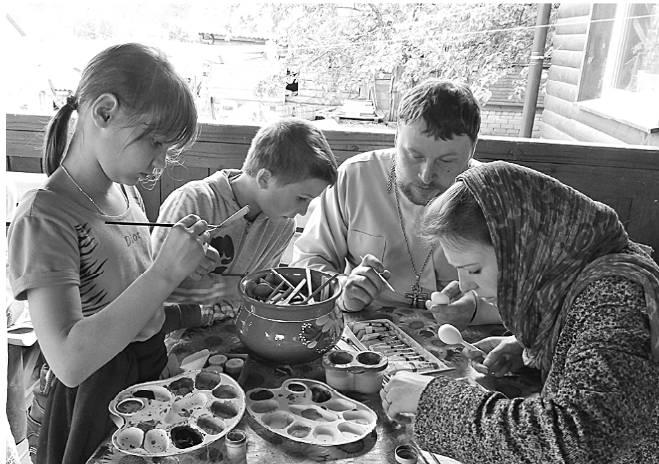
Занятия искусством в мастер-классе.