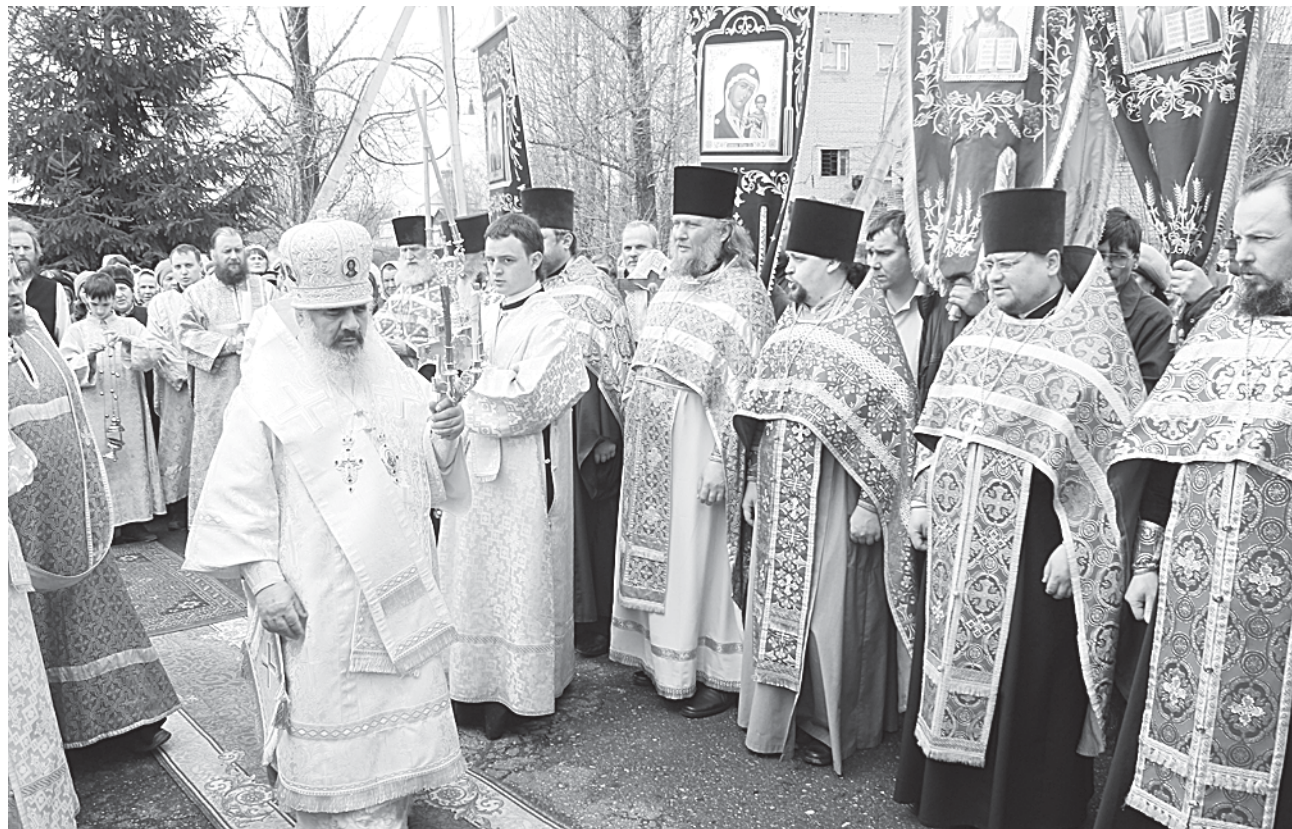
Ежегодно во второй день после Пасхи в Боровичах празднуется День святого Иакова Праведного, небесного покровителя нашего города. В течение нескольких веков в этот день после Божественной литургии крестные ходы стекаются к церкви Умиления Божией матери, где были обретыены мощи святого. Здесь и прошла торжественная служба, которую провел епископ Боровичский и Пестовский Ефрем в сослужении боровичского духовенства (на снимке).