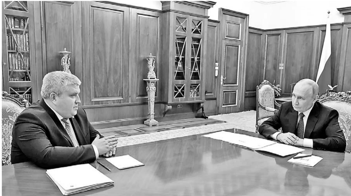
Встреча Владимира Путина с Александром Дроновым прошла в Кремле 5 марта.

Что же, неопределенность исчезла, но внимание к персоне