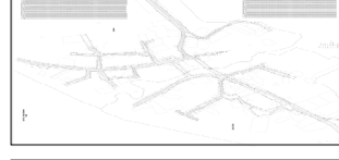
Чертеж красных линий